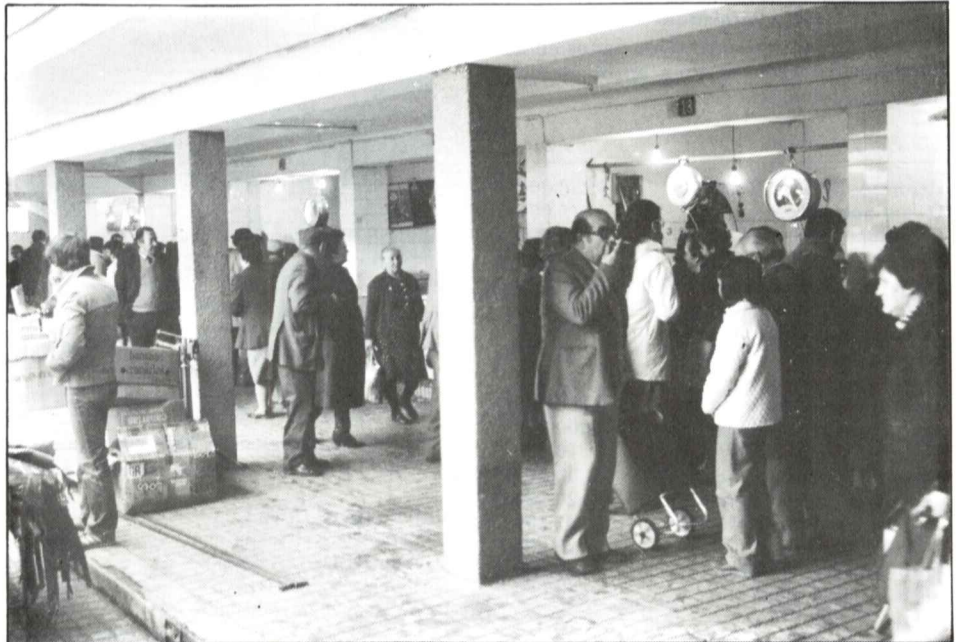
El Mercado, no siempre presenta este aspecto de visitantes.

— En el Mercado, lo primero que hice fue poner un libro de reclamaciones, que hasta ahora (tengo que decirlo) no ha utilizado