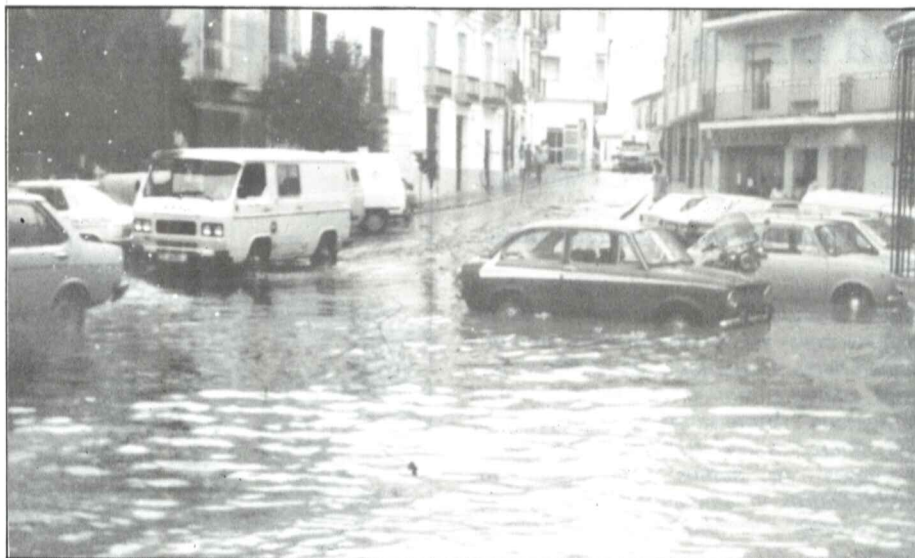
Así se veía la Carrera de Alvarez en la tarde del día 31 de Agosto de 1.983, algo más de un año después, se han recibido las indemnizaciones por los daños que causó aquella tormenta.