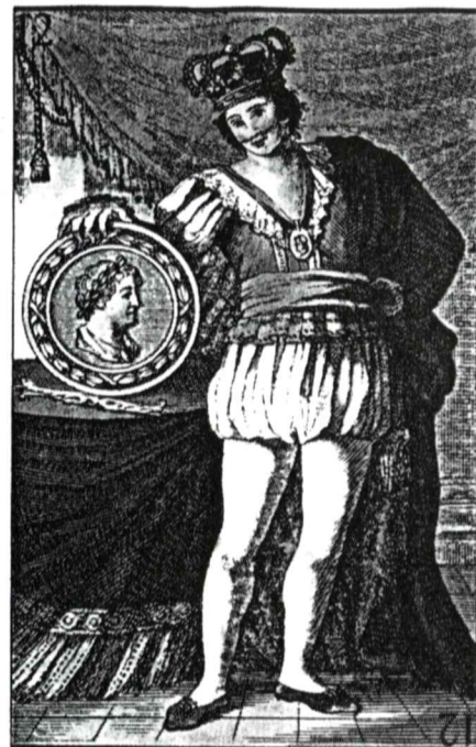
Naipes de la baraja neoclásica.

—Al principio cuando empecé grababa de la televisión las que más recordaba, más antiguas y las más bonitas, incluso compraba aquellas que eran muy conocidas y que valía la pena tenerlas.