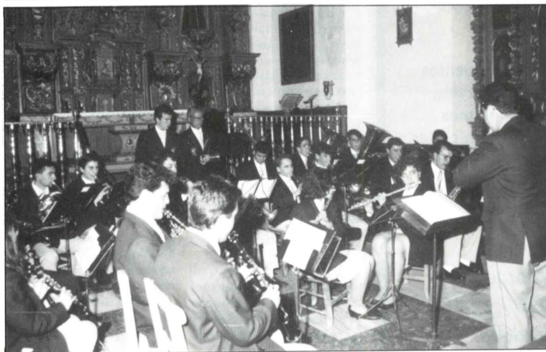
Inauguración del centro cívico y concierto de la banda de música.