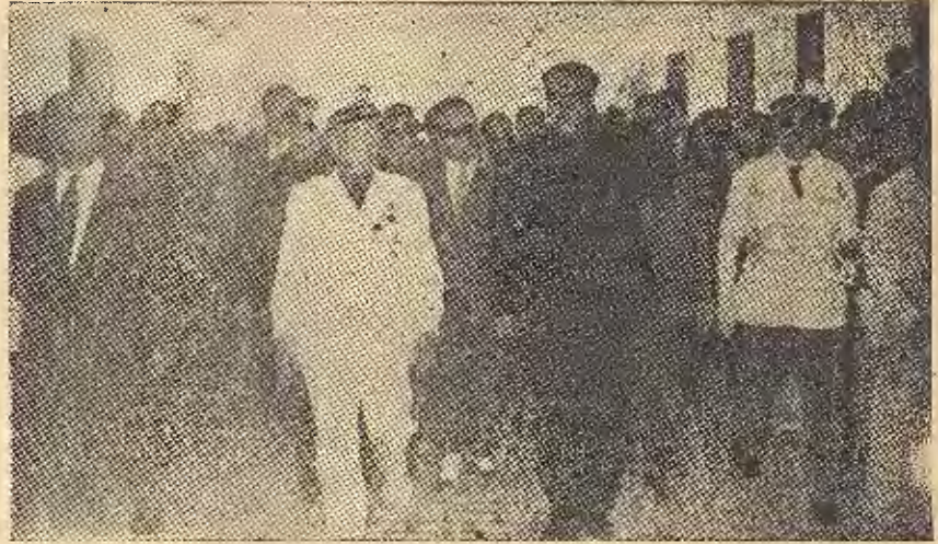
ENTRADA EN LA CIUDAD