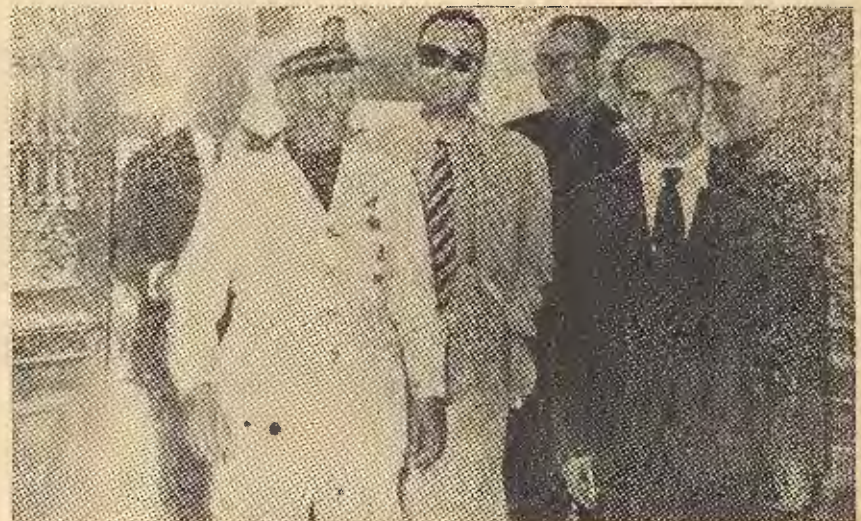
VISITA AL INSTITUTO LABORAL