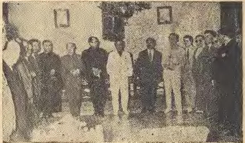
EN EL PALACIO MUNICIPAL