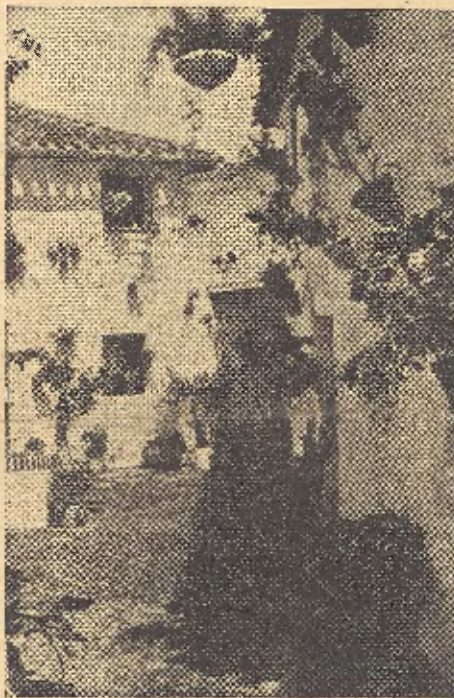
Bello rincón de la plazuela de San Antonio

La calle Jazmines, desde su mismo arranque de la Plaza del Conde hasta la Plazuela de San Antonio, era un puro jardín. Casi a la misma altura de nuestras cabezas, y a muy corta distancia, se sucedían más y más macetas, y sobre las tapias bajas, limpias y recoletas, caía el verde del follaje, invitando a un romántico paseo, para cuajar en el trozo final que desembocaba en el Patio artificial de San Antonio, con su pozo, sus plantas y sus 250 tiestos y