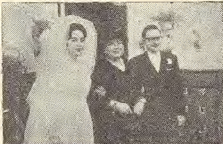
La madre de la novia acompañada de los recién casados