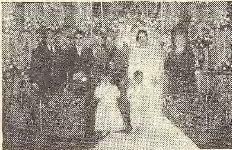
El Éxcmo. Sr. Obispo de Jaén , momentos después de la ceremonia, con los jóvenes esposos, padrinos y simpáticos portadores de arras y alianzas