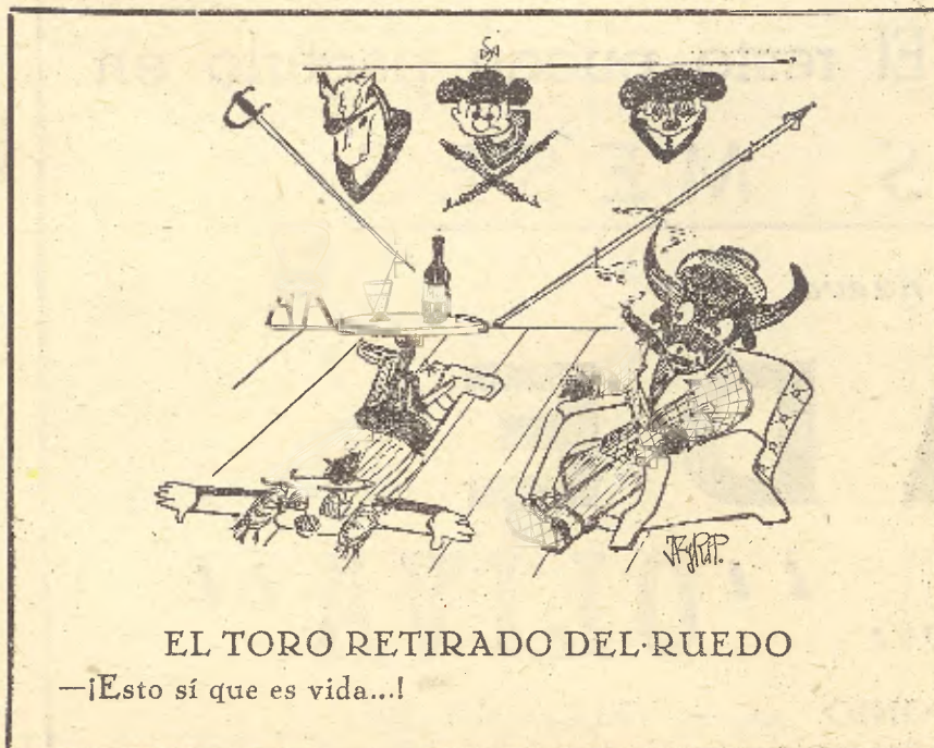
EL TORO RETIRADO DEL RUEDO