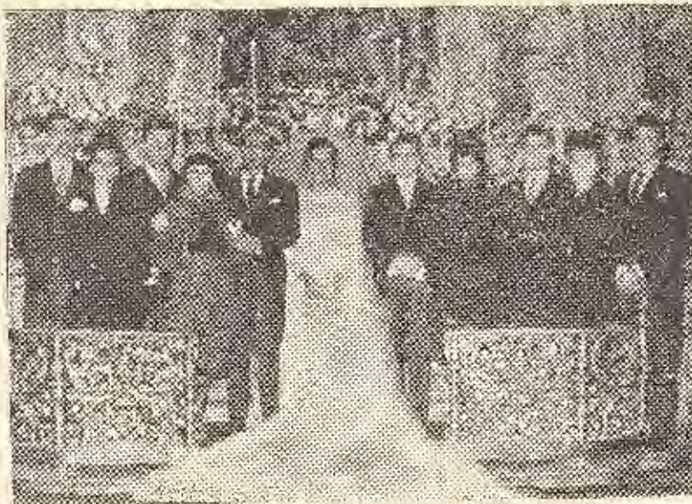
El padre del novio con sus hijos e hijos políticos junto al nuevo matrimonio